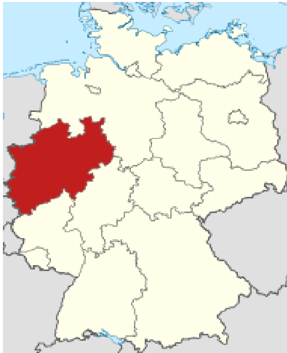
نۆردراين فيستفالن له سەر نه خشي ئه لمانيا